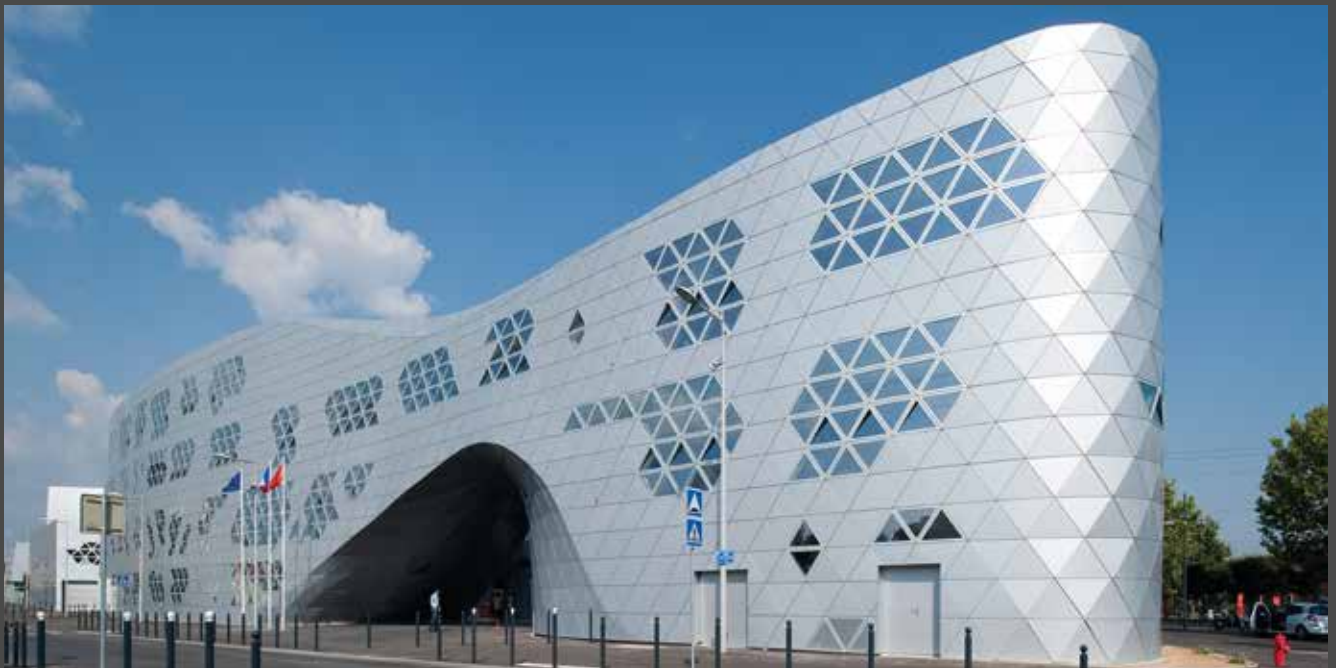
Lycée Georges Frêche, France | Architectes: Massimiliano et Doriana Fuksas, Rome, Paris | Transformateur: Tim Composites, SMAC Toulouse Matériau: ALUCOBOND® anodized look C0/EV1 | Photos: © Moreno Maggi

L'impiego di sistemi di verniciatura a base di fluoropolimeri, applicati con procedimento in continuo (coil coating), consente di tradurre in pratica l'idea originale dell'architetto senza compromessi.