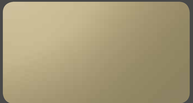
C2 LIGHT GOLD